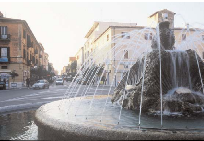
Piazza Repubblica.

Nybyen har også et mangfold av gode restauranter. Det er spesielt 2 restauranter i nærheten av Piazza Repubblica som bør nevnes: Cesare 1963 vår personlige favoritt ved siden av Bottega Sarra, blant cuicine nouveau- kjøkkene. Hostaria del Vicoletto en er blant de tradisjonelle kjøkken.