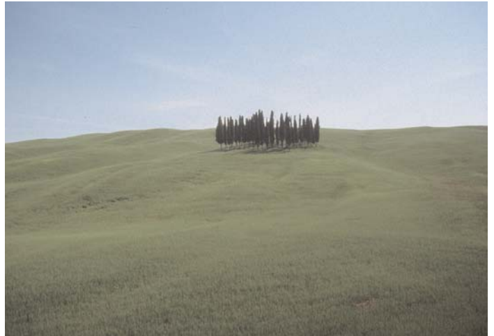
Under: Typisk syd toscansk landskap. Bildet er tatt fra området rundt Montalcino.

Montepulciano er en nydelig middelalderby på ca 600 moh, omgitt av en bymur fra 1500t. Innenfor finner man mange renessanse palasser og kirker. Gå ikke glipp av mesterverket til den kjente renessansearkitekten Sangallo, Kirken Madonna di San Biagio (ligger rett nedenfor byen). Ellers er jo byen kjent for sin Vino Nobile di Montepulciano - anbefales!